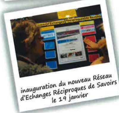
inauguration du nouveau Réseau d'Echanges Réciproques de Savoirs le 19 janvier