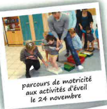
parcours de motricité aux activités d'éveil le 24 novembre