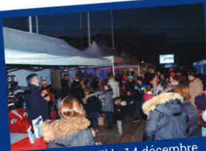
Marché de Noël le 14 décembre