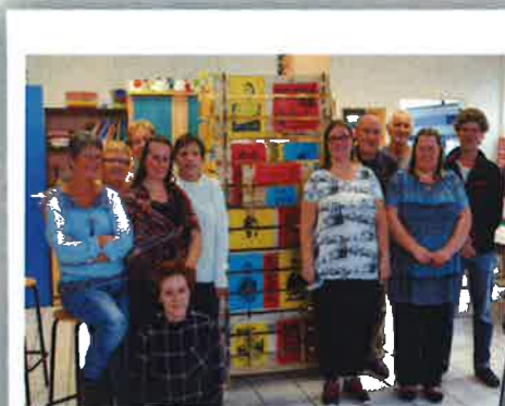
la fresque a été dévoilée au moment des VOEUX d'AGIES le MARDI 31 JANVIER

Ont contribué à l'élaboration de l'AGITATEUR n°33 :