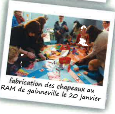
fabrication des chapeaux au RAM de gainneville le 20 janvier