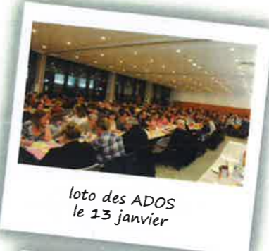
loto des ADOS le 13 janvier