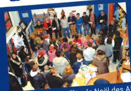
L'atelier Chant à la fête de Noël des APS le 15 décembre